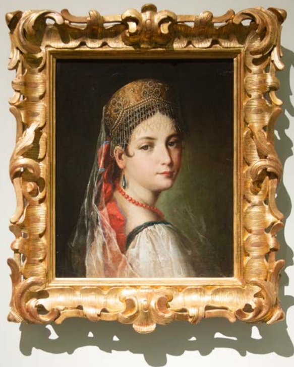
ДЕВУШКА В САРАФАНЕ И КОКОНИЦАХ М. 1800, 2013, 89/100

На выставке можно увидеть портретную галерею сановников в отставке: ближайшего сподвижника Екатерины II графа А.Г. Орлова-Чесменского, бывшего государственного канцлера И.А. Остермана, военного губернатора Ю.В. Долгорукова и многих других, кто в прошлом вершил судьбы страны. Здесь мы знакомимся с известными московскими литераторами: И.И. Дмитриевым, Н.М. Карамзиным, В.Л. Пушкиным, В.А. Жуковским; рассматриваем номера журналов «Вестник Европы» и «Русский вестник».