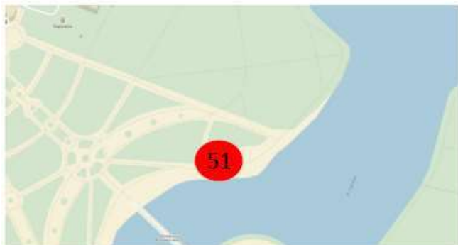
Схема размещения и фотомонтаж (графическая врисовка границ размещения) НТО № 51