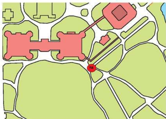
Схема размещения и фотомонтаж (графическая врисовка границ размещения) НТО № 58

Объект № 58 Расположение: Большая дворцовая поляна Вид объекта: передвижной торговый объект Специализация: мороженое