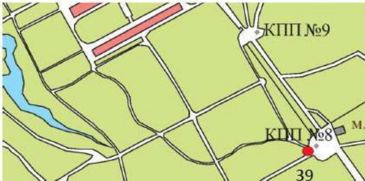
Схема размещения и фотомонтаж (графическая врисовка границ размещения) НТО № 39

Объект № 39 Расположение: ЖПП № 8 Вид объекта: передвижной торговый объект Специализация: мороженое